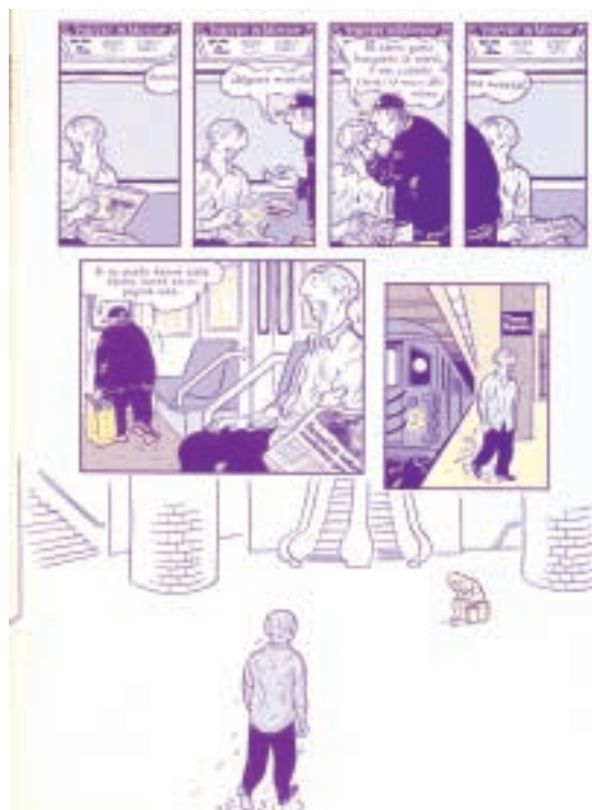
El estadounidense da un salto en las posibilidades del cómic

Pero lo que hay, sobre todo, es un cambio permanente en la imagen