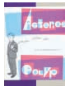
COMIC «Asterios Polyp»

Ese diseño del guión llega servido por el gran valor del libro: una espléndida puesta en página