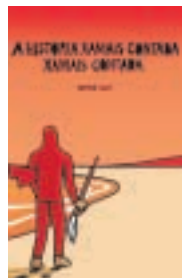
COMIC «A historia xamais contada xamais contada»

No es nada infrecuente encontrar a un escritor novel con ansias de convertir su primera novela en una gran historia, esa que nadie ha narrado antes, que ningún otro ha imaginado. Ante el papel en blanco, la cosa pinta de otra manera y cae el castillo de naipes. El gallego Mariano Casas ha convertido esa idea en tebeo, en una historia muy agradable que contrapone a dos personajes atrapados: uno por un pasado poco estimulante, enganchado a la mala vida; otro, por el ansia de un futuro reconfortante en forma de éxito narrativo. La forma en la que se entrecruzan sus vidas, las dudas que despiertan, la amistad que van hallando y la resolución vital que encuentran conforma un trabajo con un guión sin aparentes complicaciones (aunque hay un juego de dobles dibujos muy interesante), que se completa con un dibujo original, cercano a la iconografía pop, sin elemento superficial que distraigan y con una escenografía sin estridencias. El grandilocuente y